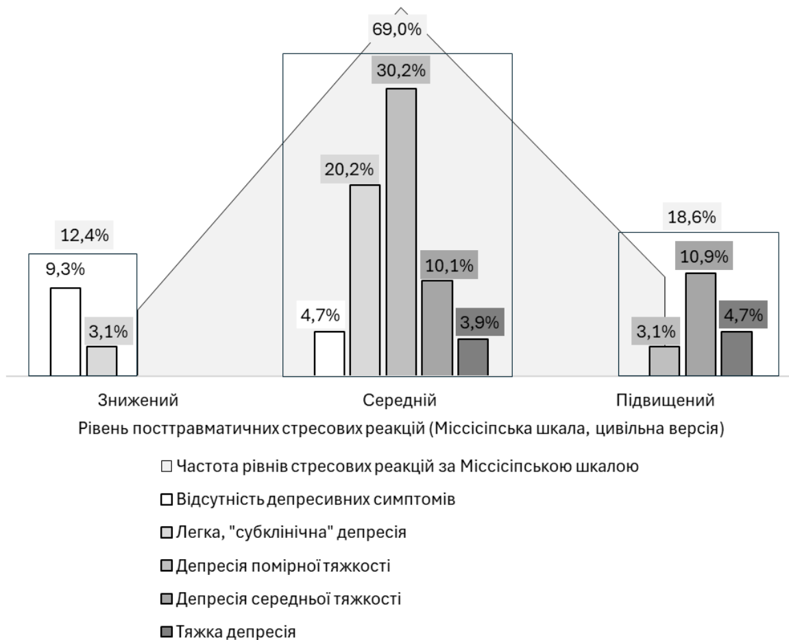
Рис. 1 – Частота депресивних проявів різної тяжкості у осіб, що зазнали впливу психотравмівних подій, згрупованих по рівнях посттравматичних стресових реакцій (порушення адаптації) за Міссісіпською шкалою.

З наведеної діаграми видно, що тяжкість депресії зростає відповідно до вираженості у пацієнтів із ПТСР стресових реакцій. Якщо при зниженому рівні таких реакцій превалює відсутність депресивних симптомів, а при середньому – депресія помірної тяжкості, то при підвищеному рівні вираженості найпоширенішою є депресія середньої тяжкості. Розподіл частоти когнітивних порушень по рівнях порушення адаптації за Міссісіпською шкалою наведено на рис. 2.